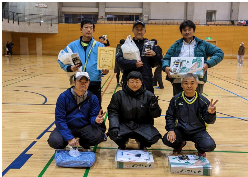
3位：たけちゃんクラブ