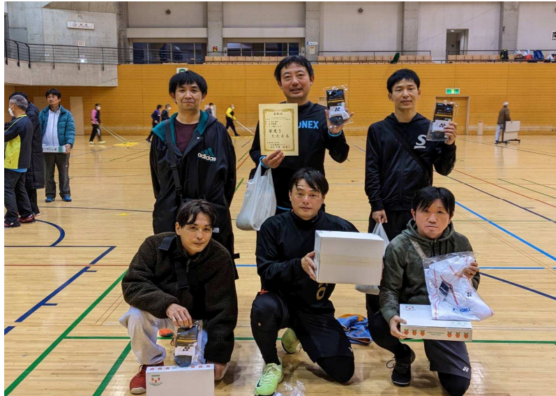
準優勝：小顔クラブ